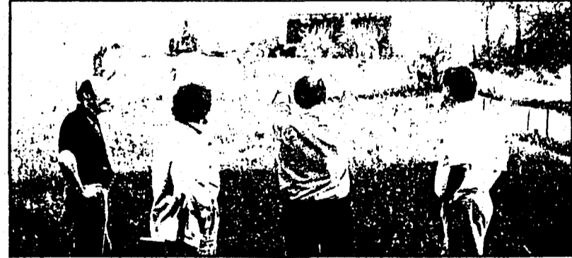
M. A. (de dos) et nos reporters dans le pré où tout a commencé.

« La lumière, d'un blanc insoutenable, ressemble à l'éclat d'une lampe halogène. Mais je ne ressens aucun dégagement de chaleur. Cependant, je n'ose pas y pénétrer. Ce n'est pas que j'aie peur, mais je suis totalement fasciné par ce que je vois.