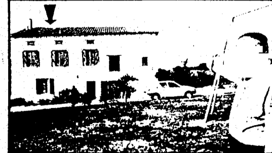
M. A. devant sa maison au toit « visité ».

regardent comme une curieuse et certains me jurent pour un fou ! « En tout cas, je peux dire une chose : ce que vu, j'en suis sûr, je suis sûr que je n'ai pas été victime d'une illusion. Mais là à dire que j'ai reçu la v. des extraterrestres, il n'y a pas question. Car je n'ai jamais cru, et je n'y crois davantage maintenant l'existence des vaisseaux venus d'un autre monde. Bien sûr, d'autres hypothèses sont envisageables : peut-être des engins spatiaux ultra secrets, ou des prototypes sur la lévitation magnétique. Mais, pour le moment, faut attendre les conclusions des experts... si elles sont rendues publiques. Après tout, certains secrets doivent de rester secrets !